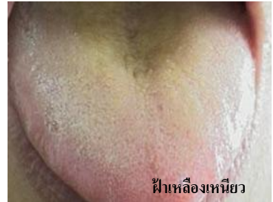
ฝ้าเหลืองเหนียว

ฝ้าสีเทาดำ --- บอกลถึงความหนาวเย็นหรือมีความร้อนอยู่ภายในมาก