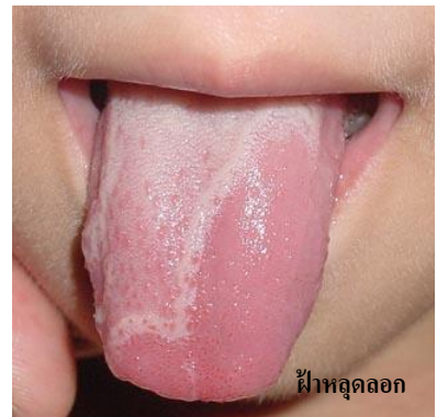
ฝ้าหลุดลอก